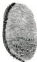
DANIELA SOLANGE SARRAS JADUE

N° Rep.: 9958 N° Firmas: 1 Derechos: $ 100000